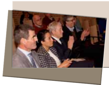
Beelden van de startmiddag van het Knooppunt Kerken en Armoede op 22 januari 2016